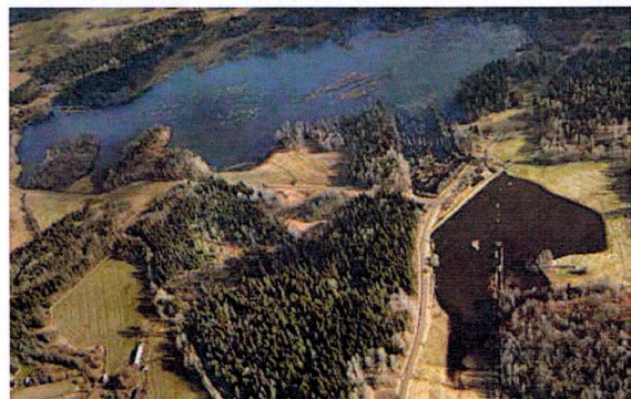
Rosenkällasjön och Edhaga våtmark

Tiderna är anpassade till kollektiva färdmedel. Tåg inkommer från Vimmerby/Kisa kl. 08.49. Avgår mot Kisa/Vimmerby kl. 16.24.