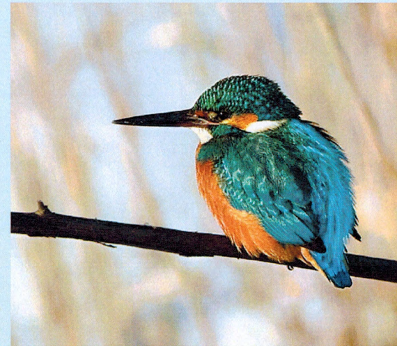
Kungsfiskare, ansvarsart för Linköpings kommun

Medtag matsäck till för/eftermiddagsfika!