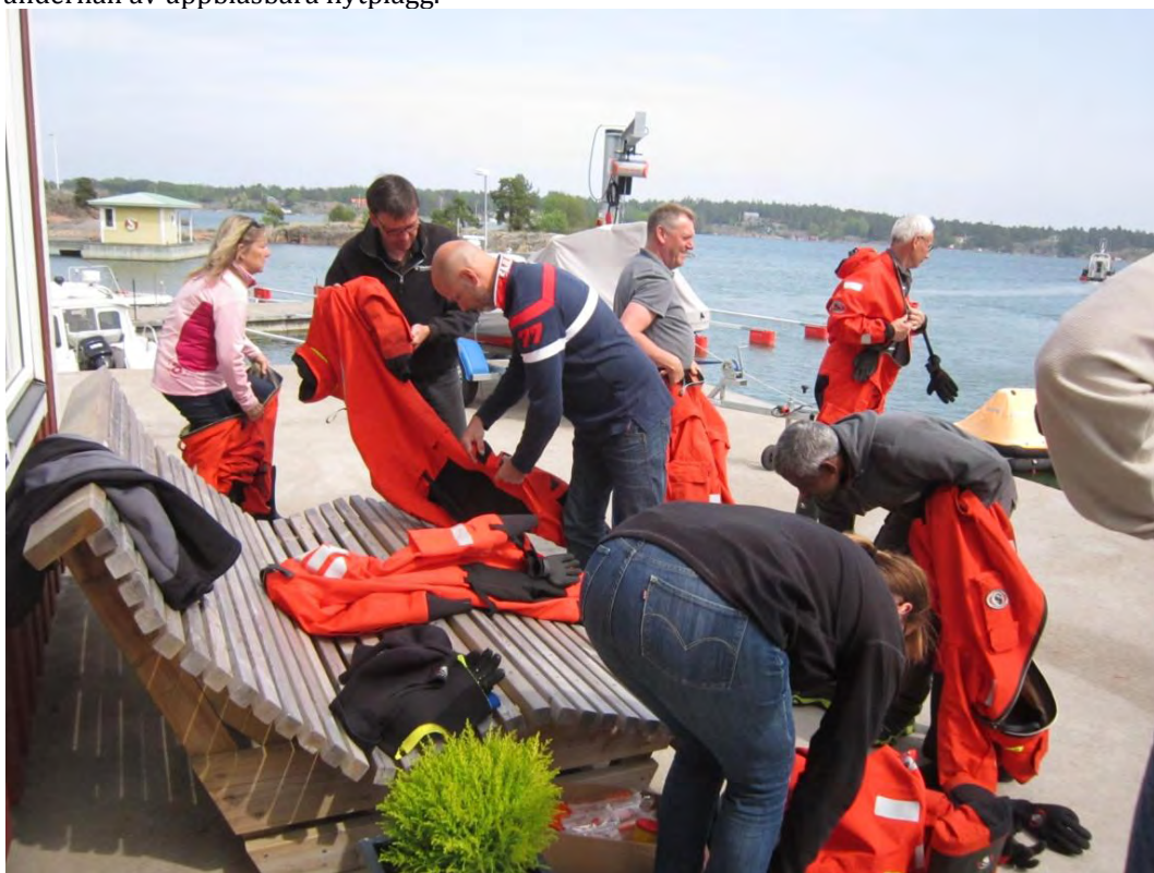
Kursdeltagare tar på sig räddningsdräkterna, för att snart hoppa i vattnet.